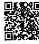
เอกสารประกอบการ พิจารณา สำนักวิชาการ