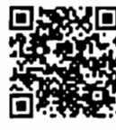
บันทึกการประชุมสภา สำนักรายงาน การประชุมและชวเลข